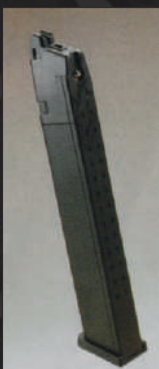
Per aumentare l'autonomia di tiro della replica, l'abbiamo dotata di un AAP01 Assassin Gasblowback Lightweight Gas Magazine Action Armi da 50 colpi.