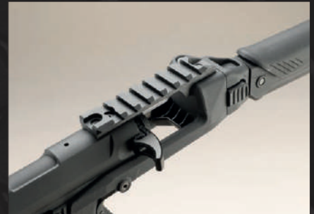
Unire il calcio all'upper receiver usando come giunto la piccola scina in dotazione al kit.