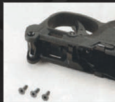
Estrarre le due viti esagonali laterali e quella interna a croce.