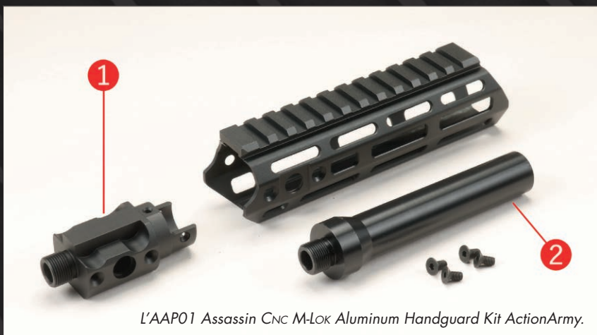
L'AAP01 Assassin CNC M-Lok Aluminum Handguard Kit ActionArmy.

Per trasformare la nostra pistola in una carabina, le applicheremo innanzitutto un rail system per conferirle la dovuta espansibilità. Naturalmente, occorre un prodotto dedicato, quindi scegliamo l'AAP01 Assassin CNC M-Lok Aluminum Handguard Kit dell'ActionArmy. Il paramano è provvisto di slitta Picatinny superiore e attacchi M-Lok sui restanti lati.