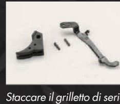
Staccare il grilletto di serie dalla sua asta.