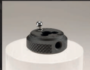
Applicare i componenti 7 e 5 alla manopola 1.