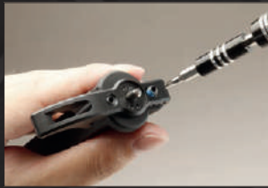
Applicare la manetta d'armamento al gruppo otturatore e fissare coi due grani a brugola.