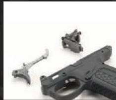
Rimuovere il grilletto e il gruppo di scatto dal castello.