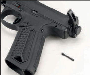
Estrarre lo spinotto zigrinato dalla parte posteriore del castello.