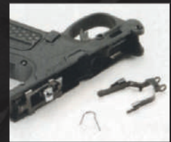
Rimuovere la leva dello slide stop insieme alla sua molla.