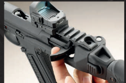
La manetta d'armamento si manovra agevolmente. Essendo reversibile, in fase di montaggio si può scegliere il lato da cui farla sporgere.