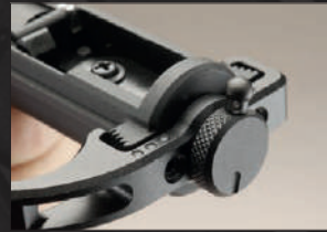
Montare la manopola applicandola al componente 3 e fissarla con la vite 6.