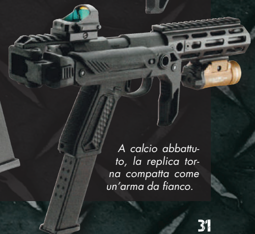
A calcio abbattuto, la replica torna compatta come un'arma da fianco.