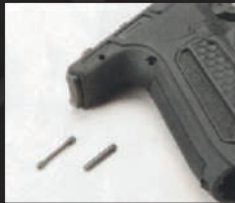
Estrarre i due spinotti zigrinati che fissano il gruppo di scatto al castello.