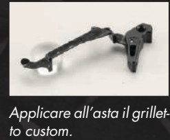
Applicare all'asta il grilletto custom.

L'elaborazione interna della nostra AAPO1 è terminata, ora si tratta di passare alle parti esterne.