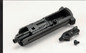
Smontare il meccanismo del selettore di tiro.