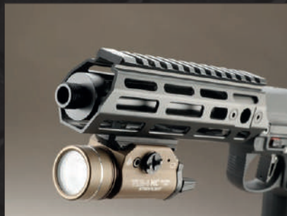
Alla scina potremo applicare una weapon light, mentre alla filettatura della volata un silenziatore o un Full Auto Tracer.