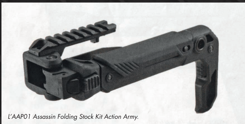
L'AAP01 Assassin Folding Stock Kit Action Army.

Montiamo il paramano e lo fissiamo al gruppo inner barrel con le viti in dotazione.