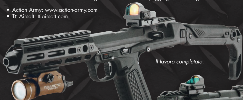
Il lavoro completato.