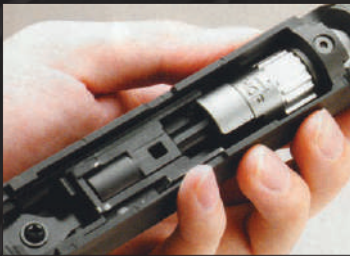
L' AAP01 Assassin CNC Aluminum Precision Hop Chamber è dotata di un comodo registro a tamburo.