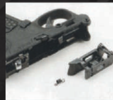
Rimuovere il front chassis insieme alla molla di ritorno del grilletto.