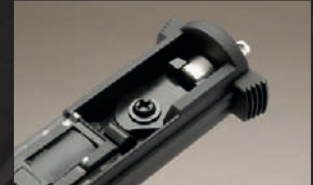
Sostituire il meccanismo del selettore con le parti 3 e 4.