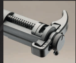
Montare i componenti 8 e 9.