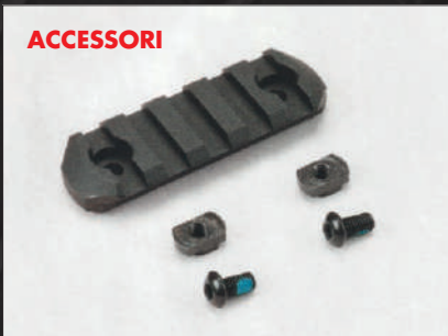
Monteremo un' AAP01 Handguard M-Lok Multi CNC Aluminum Rail 60 mm Action Army al lato inferiore del paramano.