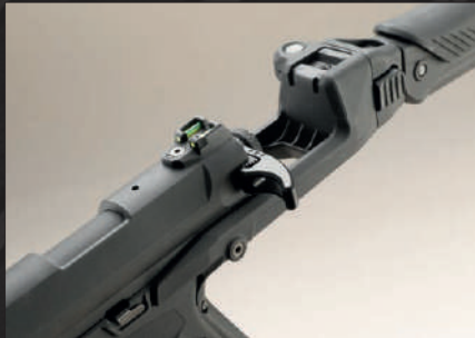
Fissare il calcio al castello utilizzando lo spinotto in dotazione al kit.