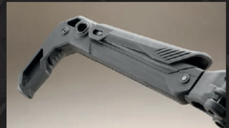
Il calcio è regolabile in lunghezza. Quando abbattuto, può essere utilizzato come foregrip. Il poggia-guancia è regolabile in altezza.