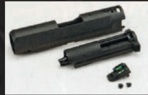
Smontare la tacca di mira ed estrarre il gruppo otturatore.