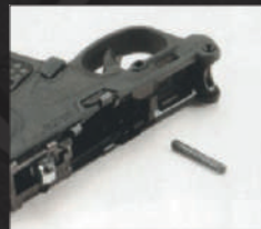
Estrarre lo spinotto zigrinato che funge da perno del grilletto.