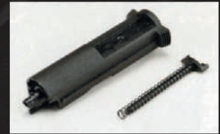
Staccare la molla di ritorno e il relativo guidamolla.