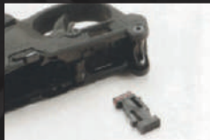
Rimuovere la sicura cross-bolt dalla sua sede.