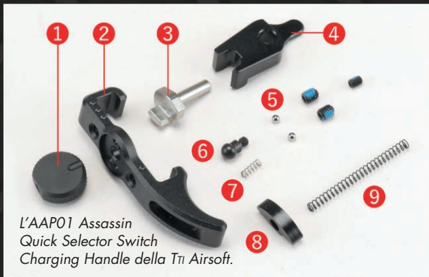
L'AAPO1 Assassin Quick Selector Switch Charging Handle della TTI Airsoft.

Il selettore di tiro dell'AAPO1 è all'interno del gruppo otturatore, il che lo rende abbastanza scomodo da gestire. Per questo lo sostituiamo col Quick Selector Switch Charging Handle della TTI Airsoft.