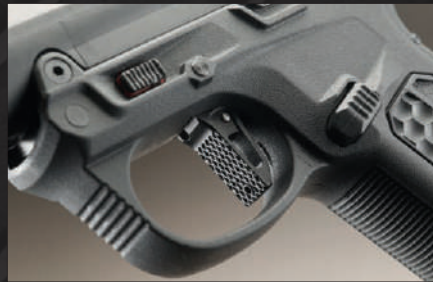
Col montaggio del trigger kit custom si è notevolmente ridotta la corsa del grilletto.